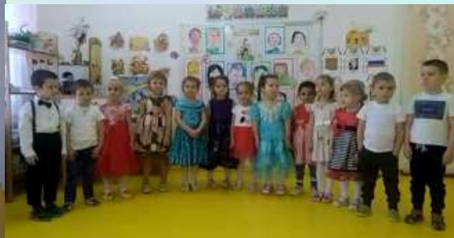
Песня «Маме» З. Качаевой