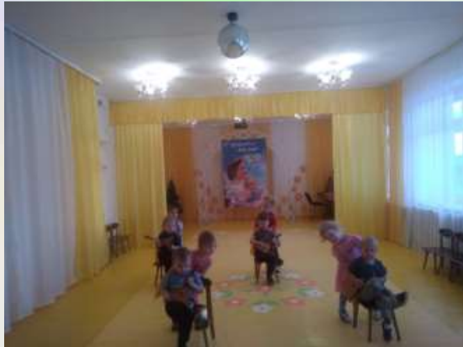
«Танец с балалайками»