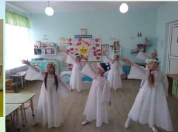
Танец «Ангел летит»